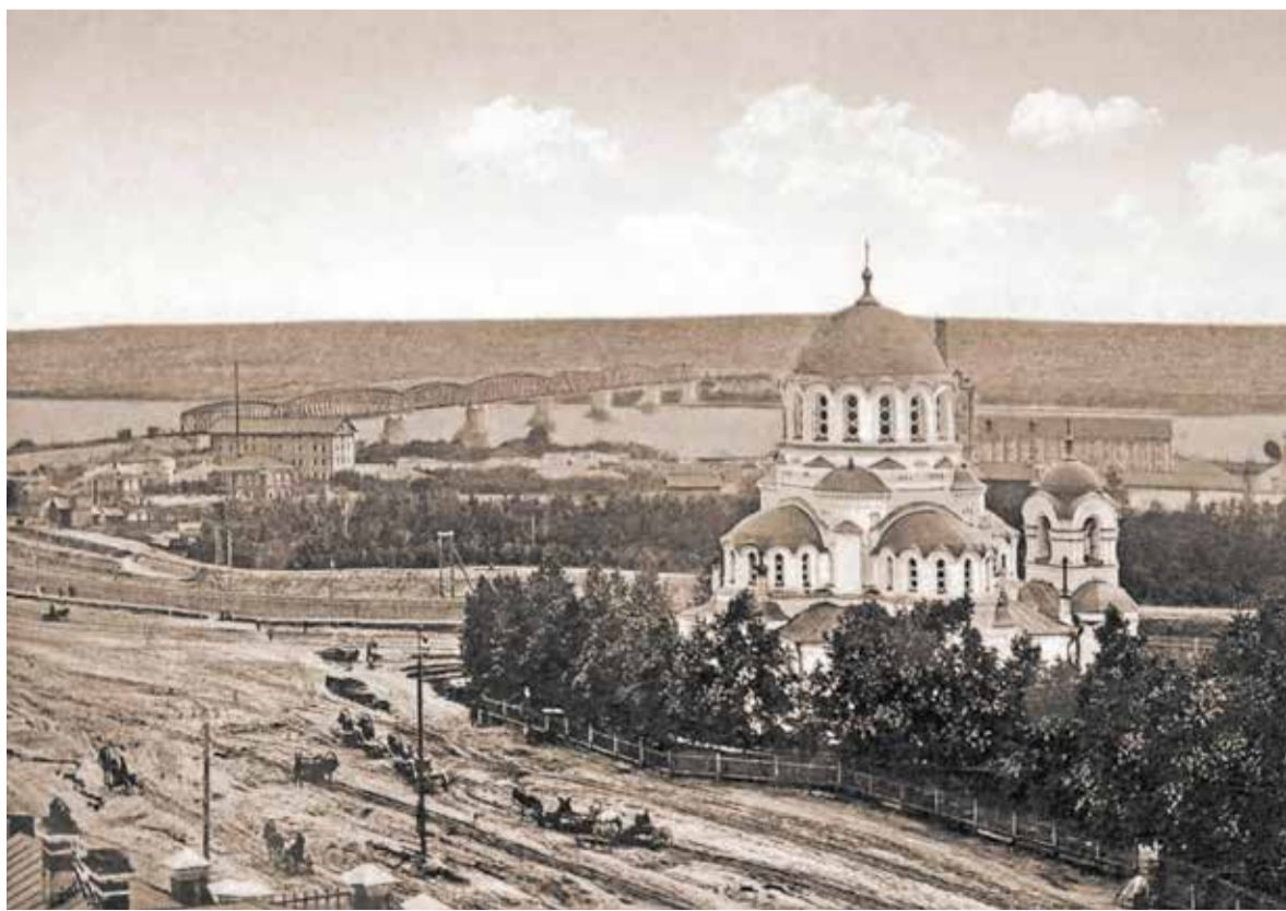
Вид на Александро-Невский собор и железнодорожный мост через Обь

Духовному возрождению города служит восстановление храмов и часовен, которые были созданы в Ново-Николаевске еще до учреждения в 1924 году самостоятельной Ново-Николаевской епархии.