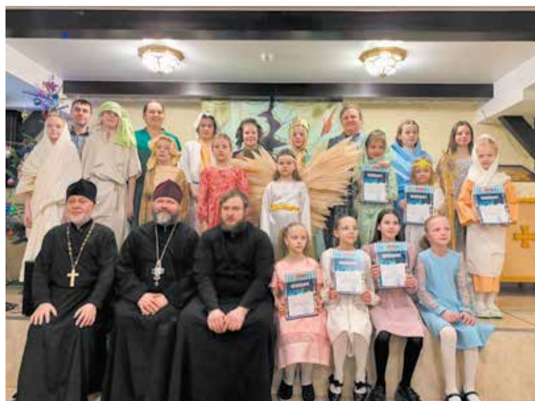
Приходской концерт в храме в честь Покрова Пресвятой Богородицы