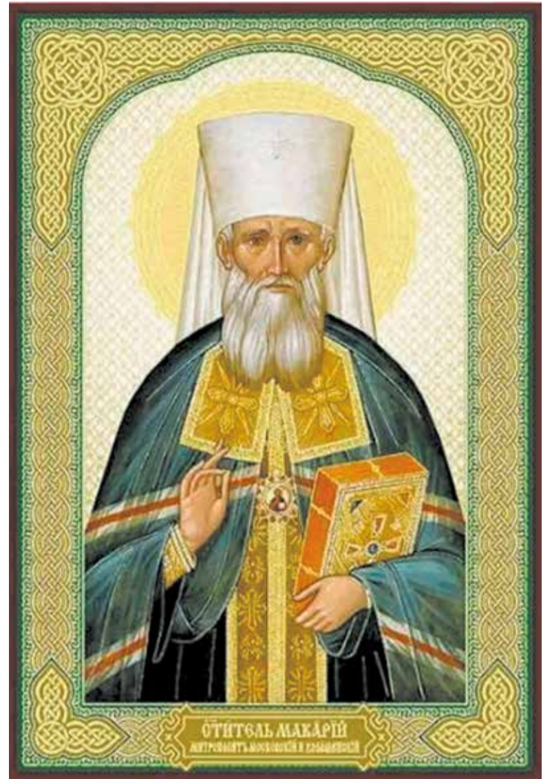
Святитель Макарий, митрополит Московский и Коломенский. Икона

В 1913 году в военном городке Ново-Николаевска на средства