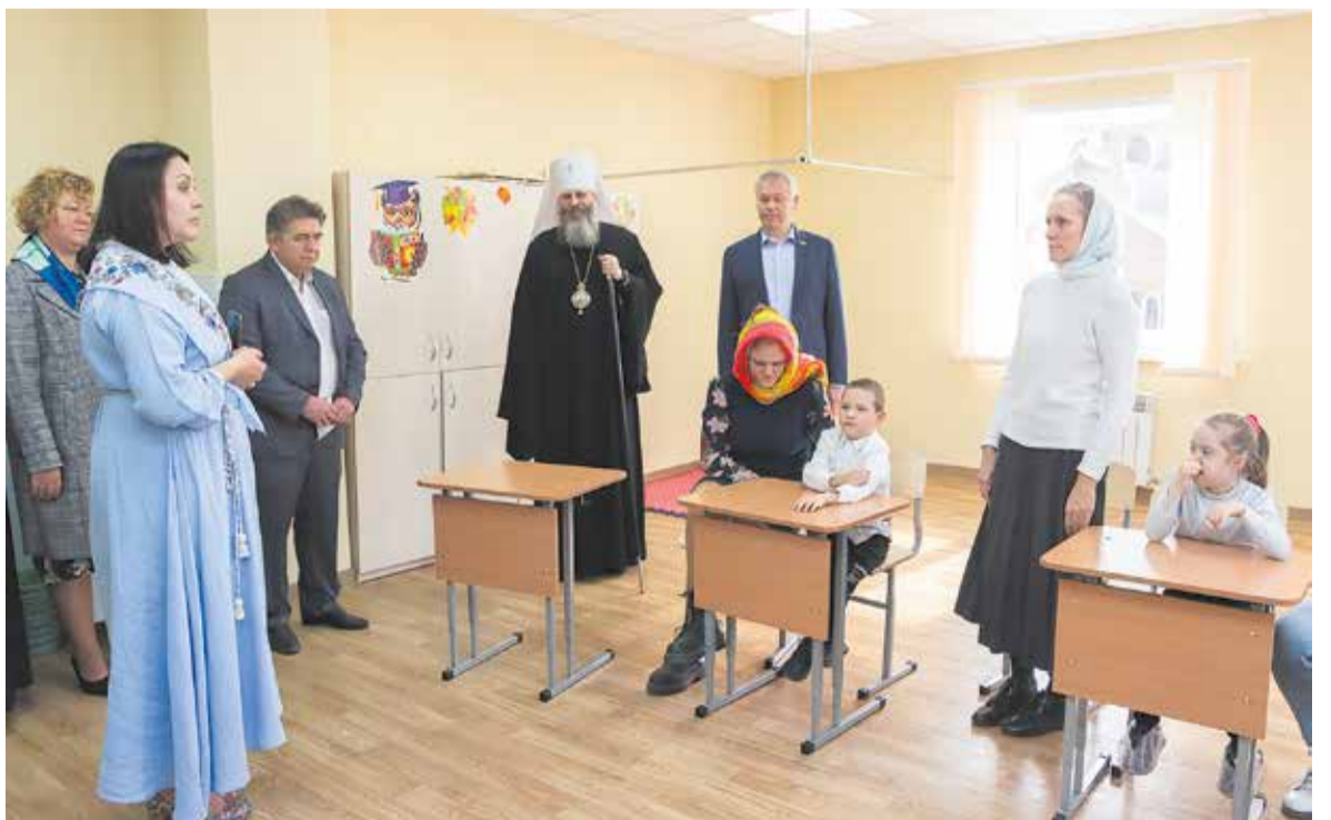
После освящения второго корпуса медицинского центра «Святитель Лука»

Призыв времен Великой Отечественной войны «Всё для фронта, всё для Победы!» с началом специальной военной операции на Украине вновь стал актуальным. Следует отметить, что Новосибирская епархия оказывает помощь беженцам с Украины с 2014 года. Таким образом был приобретен достаточный опыт, который пригодился с началом специальной военной операции, когда поток беженцев значи-