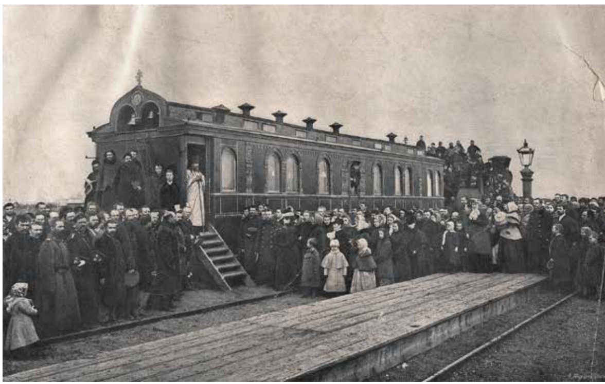
Вагон-храм во имя святой княгини Ольги

Жизни и деятельности митрополита Никифора будет посвя-