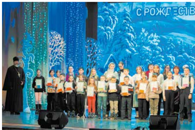
Районный концерт «Под рождественской звездой»