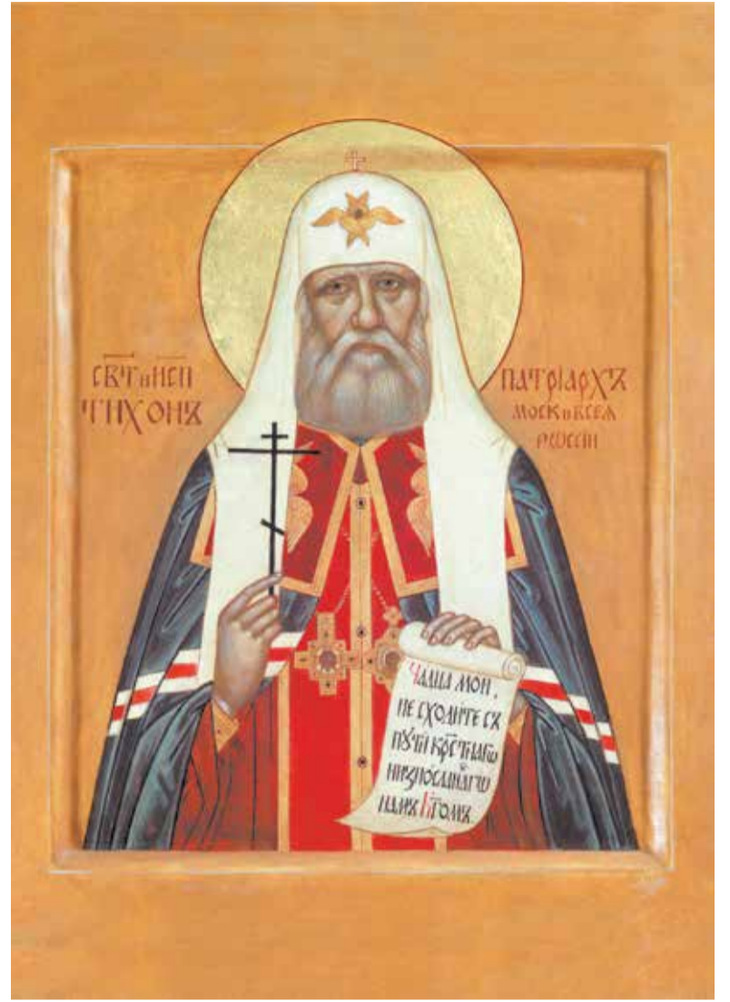
Святитель и исповедник Тихон, Патриарх Московский и всея Руси. Икона

Огромный вред церковной жизни в ту эпоху несло обновленчество, кульминацией которого стал обновленческий «собор» 1923 года. Собор был сорганизован по подобию собраний политического характера. Выборы на него происходили по спискам, места на «соборе» распределялись по числу голосов, поданных за каждый список. Явившись на «собор», члены его тотчас же разбились на партийные группы, решившие, как каждая должна голосовать по вопросам, предлагаемым на обсуждение. Наиболее важными характерными чертами обновленчества были признание «справедливости совершившегося в стране социального переворота», теснейшее сотрудничество с советской властью, а в первые го-