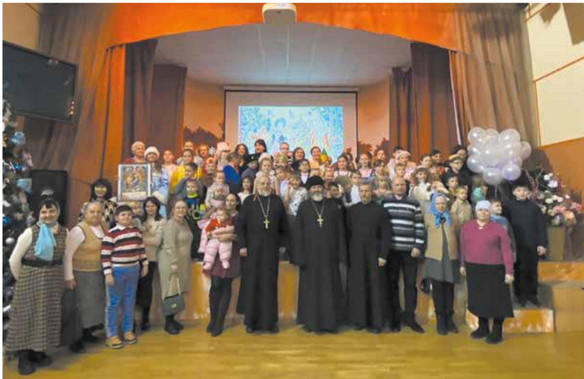
Утренник в воскресной школе Успенского прихода (Кировский район)