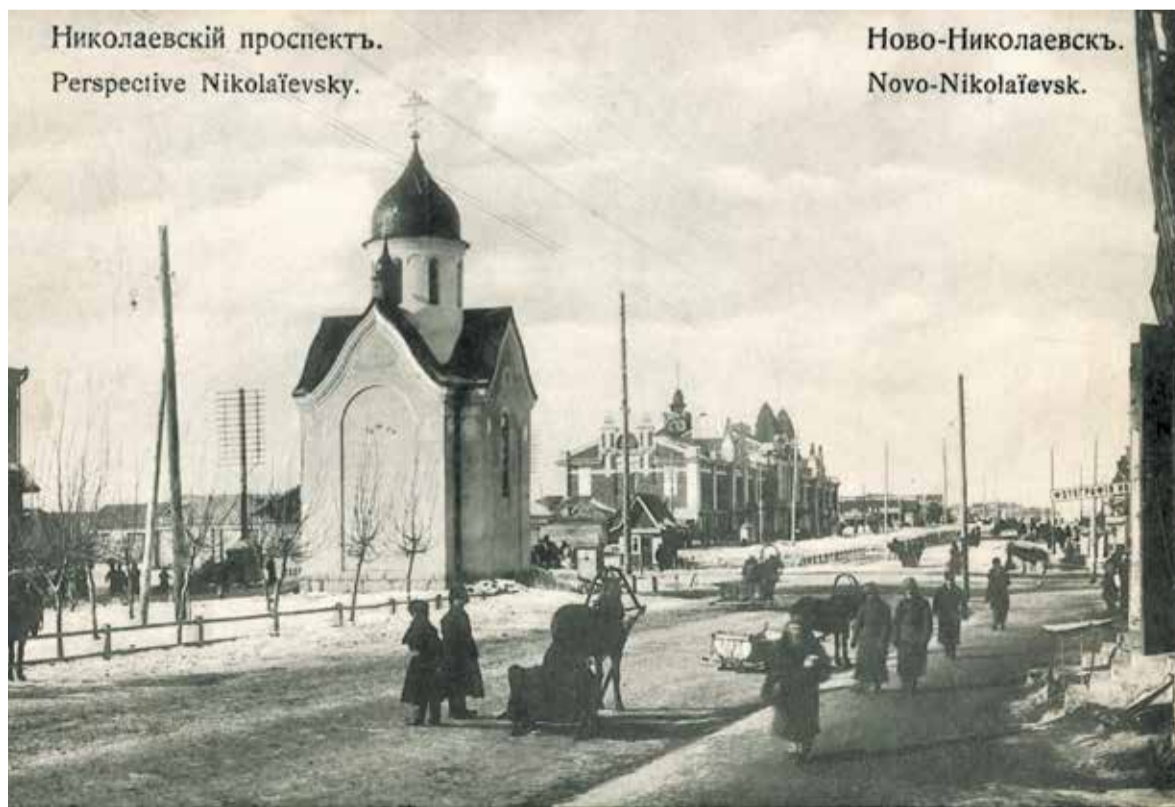
Часовня Святителя Николая на Николаевском проспекте