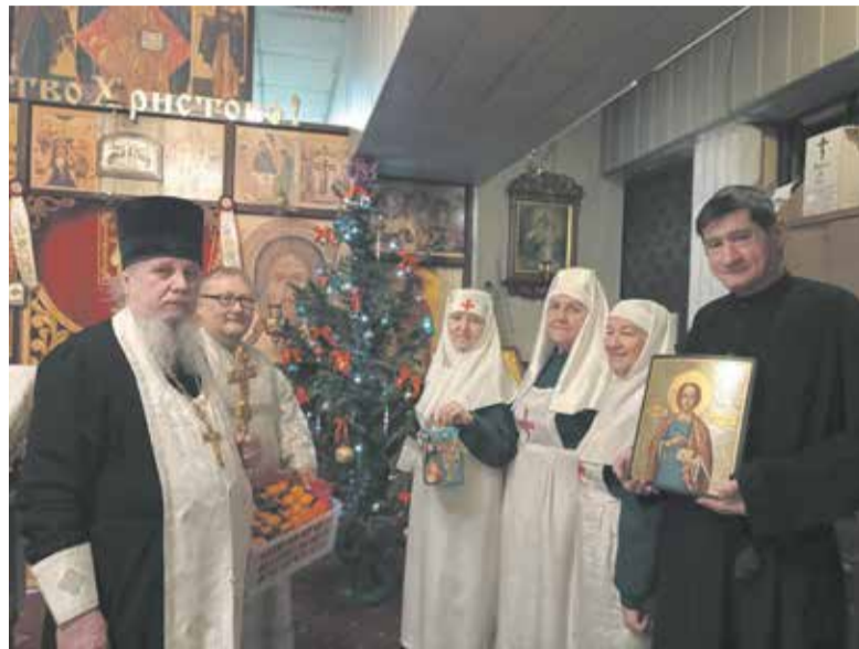
Рождество Христово в Новосибирском доме ветеранов

Певчие храма исполнили богослужебные песнопения праздника, колядки и Рождественские песни разных народов.