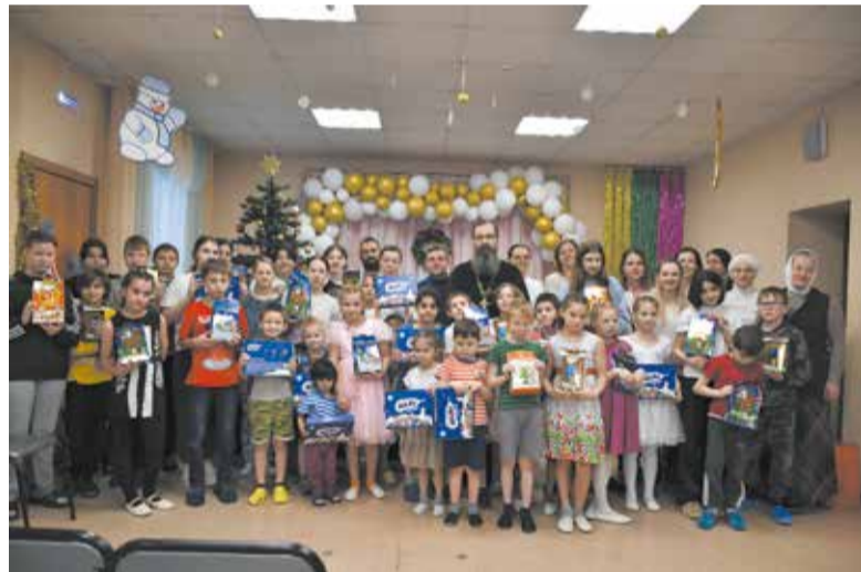
В гостях у воспитанников социально-реабилитационного центра «Снегири»