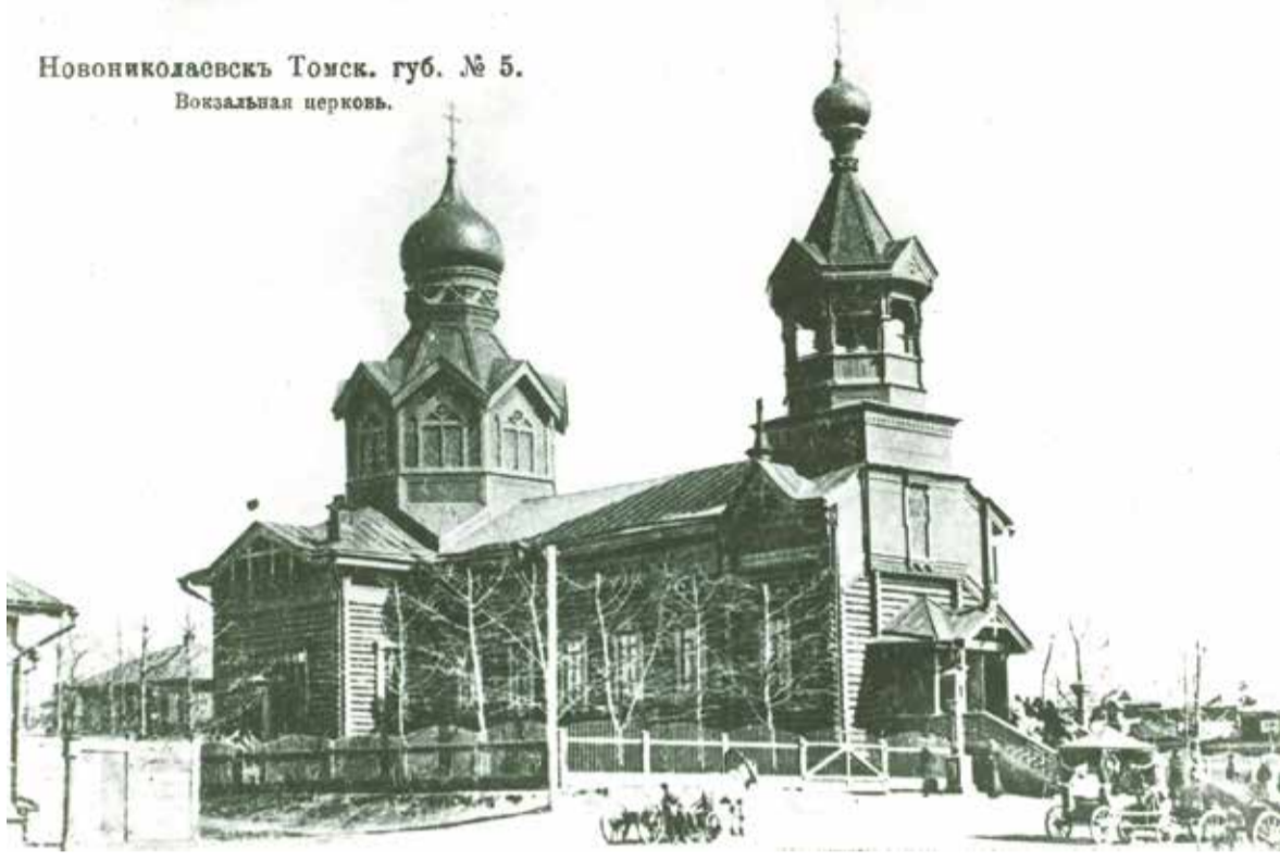
Церковь во имя пророка Божия Даниила (Вокзальная)

Представленный исторический обзор того, как Новосибирск занял важнейшее положение в Сибири, помогает понять, как в 40–80-е годы XX века сформировалась огромная Новосибирская