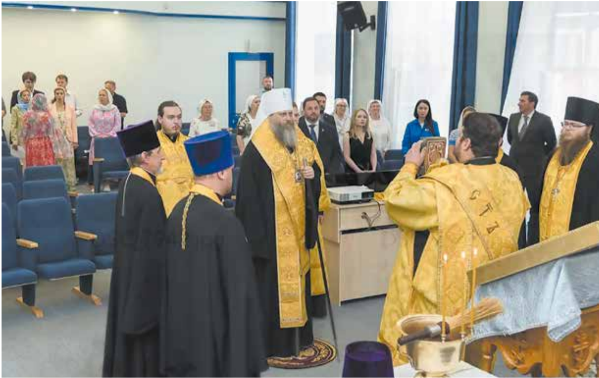
Освящение клиники НИИТО

Итак, будьте милосердны, как и Отец ваш Небесный милосерден (Лк. 6, 36)